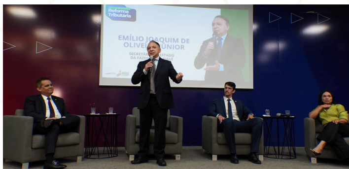
3ª edição do projeto “Dialogando sobre a Reforma Tributária”

Realizados na Ordem dos Advogados do Brasil – Seccional Piauí, os eventos reuniram autoridades, especialistas e auditores fiscais, fortalecendo a educação fiscal e o diálogo com a sociedade. Durante a 3ª edição, também foi lançado oficialmente o portal da Reforma Tributária no Piauí.