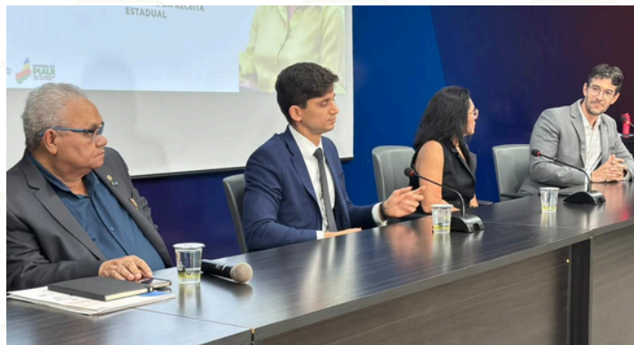
6ª edição do Dialogando Sobre a Reforma Tributária