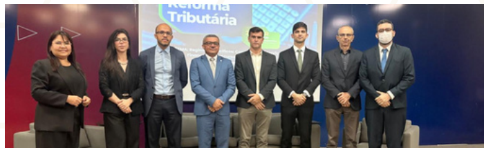
5ª edição do projeto “Dialogando sobre a Reforma Tributária”