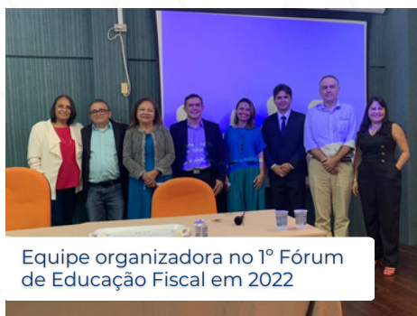
Equipe organizadora no 1º Fórum de Educação Fiscal em 2022