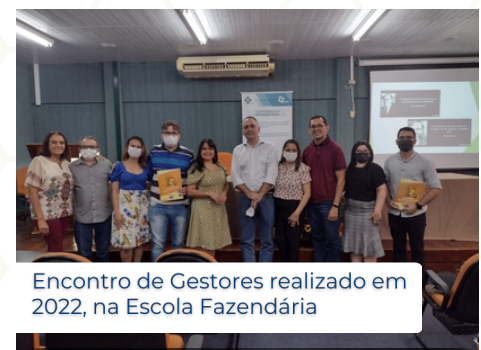
Encontro de Gestores realizado em 2022, na Escola Fazendária