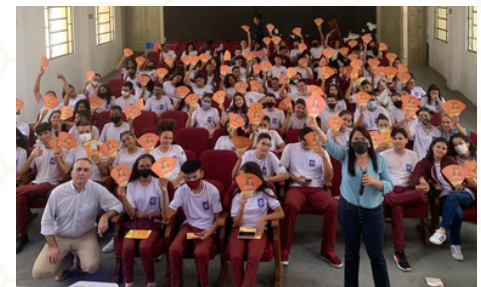
Ciclo de Palestras sobre Educação Fiscal nas Escolas de Tempo Integral

Entre as ações desenvolvidas no Piauí, destacam-se: o Ciclo de Palestras sobre “Organização do Estado e Tributação & Gasto Público e Controle Social” nas Escolas Públicas do Estado, Fórum de Educação Fiscal, Seminários e Projeto Cidadania na Escola.