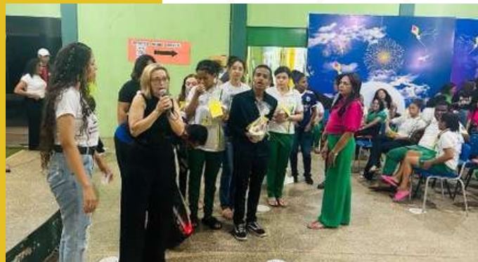
17 DE NOVEMBRO 10º GRE - FLORIANO MUNICÍPIO: FLORIANO U.E OSVALDO DA COSTA E SILVA PROJETO: Orçamento Público: Conhecendo Os Instrumentos De Planejamento De Forma Dinâmica