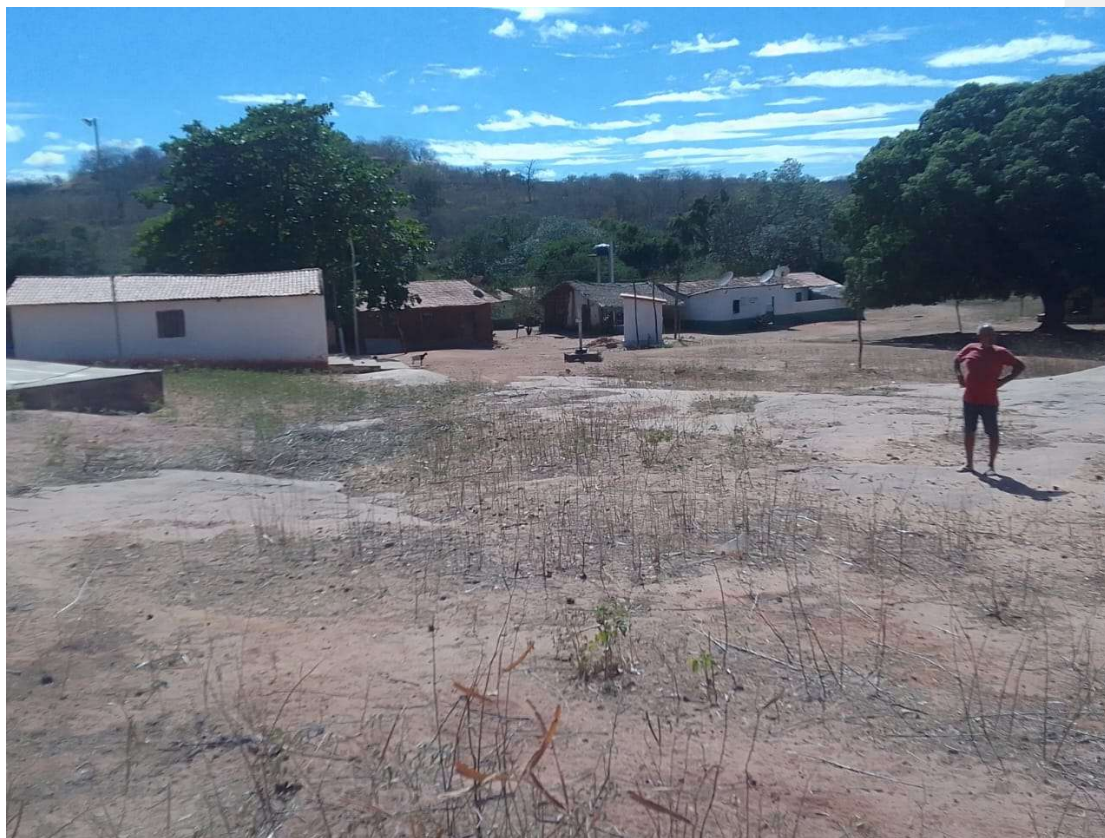
Praça da UBS José Paraguassu / Zona Urbana de Floriano – PI

Povoado São Matheus – Município de Canavieira – PI